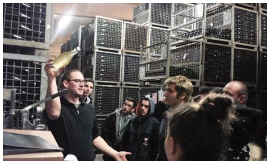
Palackos erjesztés és érlelés

A 10. és 11. borász osztály január 26-án szakmai tanulmányúton vett részt az ausztriai Golsban. Megtekintettük a Szigeti pezsgógyárat. A gyárban lépésről lépésre végigkísértük a pezsgógyártás folyamatát. A fiatal, magyar származású pincemester sok humorral fűszerezve avatott be bennünket a pezsgógyártás fortélyaiiba.